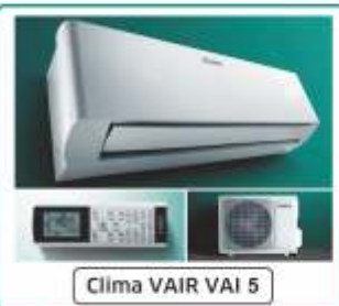
Clima VAIR VAI 5