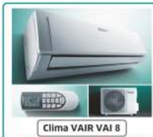
Clima VAIR VAI 8

Fino Mornasco (CO) - Via Garibaldi, 54 Tel. 031 927.812 - Caronno Pertusella (VA) - Via E. Toti, 250 Tel. 02 965.06.02 www.nuovaenergiasrl.it - info@nuovaenergiasrl.it