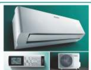
Clima VAIR VAI 5

Service plus CENTRO ASSISTENZA TECNICA UFFICIALE