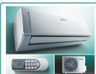
Clima VAIR VAI 8

Fino Mornasco (CO) - Via Garibaldi, 54 Tel.031 927.812 - Caronno Pertusella (VA) - Via E. Toti, 250 Tel.02 965.06.02 www.nuovaenergiasrl.it - info@nuovaenergiasrl.it