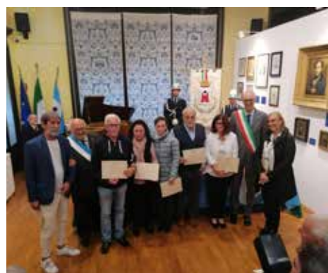
Pergamene agli ex dipendenti