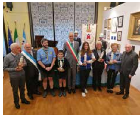
Le Ciocchine 2023

La cerimonia si è chiusa con la consegna della targa di ringraziamento per il servizio reso al Comune di Saronno agli ex dipendenti andati in pensione nel corso dell'ultimo anno.