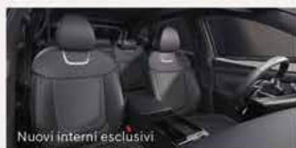
Nuovi interni esclusivi