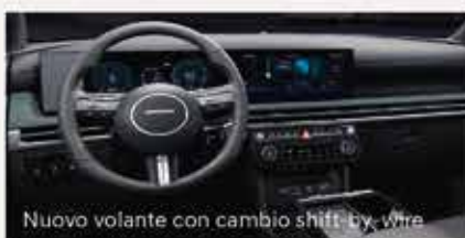
Nuovo volante con cambio shift-by-wire