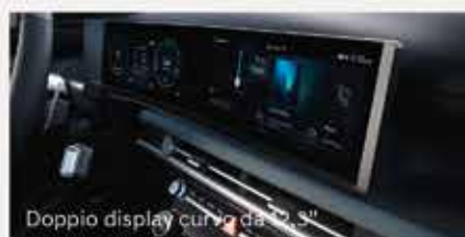
Doppio display curvo da 12,3"

Nuova Hyundai TUCSON, più tecnologia e connettività di ultima generazione. In più, tre motorizzazioni per soddisfare le esigenze di tutti: Mild Hybrid Benzina o Diesel, Full Hybrid e Plug-in Hybrid. Scopri la Gamma TUCSON, e la versione speciale 20° anniversario su Hyundai.it e nei nostri showroom.