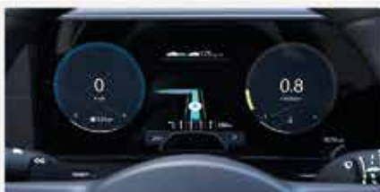
Sistema di assistenza alla Guida Hyundai Smart Sense