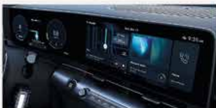
Doppio display curvo con navigatore e connettività Apple Car Play e Android Auto**