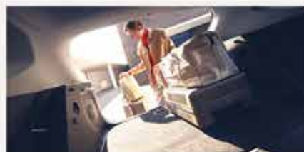
Bagagliaio di 466 litri

Nuova Hyundai KONA è spazio, comfort e capienza best in class. In più, tecnologia e funzioni di connettività di ultima generazione. Disponibile in tre versioni per soddisfare tutte le esigenze: Benzina, Hybrid e 100% elettrica. Scopri la Gamma KONA su Hyundai.it e in tutti i nostri showroom.