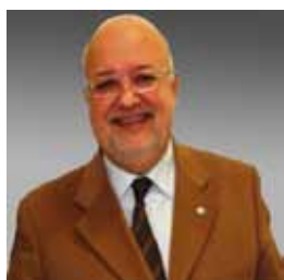
Gilli Voti 1867 8,56%