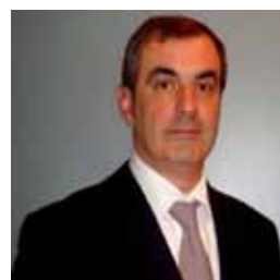
Marzorati Voti 9566 43,84%