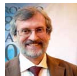
Porro Voti 8832 40,48%