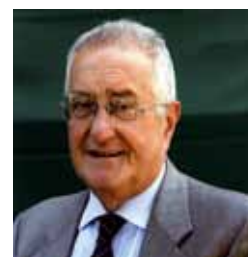
Giannoni Voti 324 1,49%