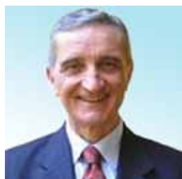
Proserpio Voti 1229 5,63%