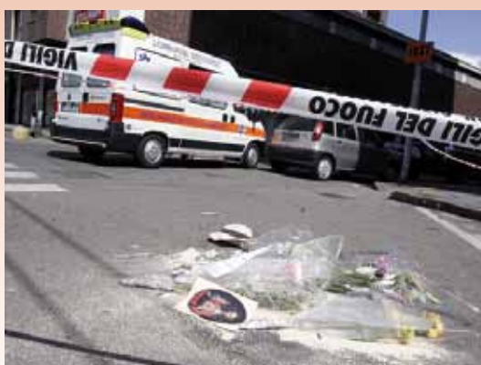
Ogni anno sono oltre 35.000 i cittadini europei che perdono la vita sulle strade.

L'obiettivo è ambizioso: dimezzare, entro il 2020, il numero di morti e feriti per incidente stradale in tutta la Comunità Europea. Secondo il Comitato dei Trasporti del Parlamento Europeo, infatti, ogni anno sono ben 35 mila le persone che perdono la vita e oltre un milione e mezzo quelle che subiscono gravi infortuni a causa di un incidente stradale. Per raggiungere tale obiettivo, il Comitato ha tracciato alcune linee guida tra cui vale la pena di segnalare l'introduzione del limite di velocità di 30 km/h in tutte le aree residenziali, per proteggere pedoni e bambini (potete leggere le altre cercando "30 km/h" sul sito www.europarl.europa.eu ). Una scelta che è stata salutata con favore da tutti coloro che, in Europa, auspicano da tempo l'introduzione per legge di provvedimenti di questo tipo, arrivando a città che siano soggette al limite di 30 km/h su tutto il territorio. Tra gli enti che sostengono tale linea vale la pena di ricordare l'attissima comunità inglese 20's Plenty For Us ( www.20splentyforus.org.uk ), che da diversi anni promuove l'introduzione del limite a 20 mph (32 km/h) in tutte le aree urbane. Visitando il loro sito, troverete moltissime informazioni riguardo alle iniziative portate avanti in Gran Bretagna in tale senso.