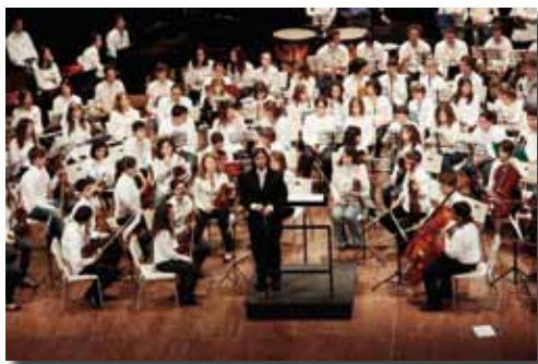
Orchestra Giovanile della Nuova Scuola di Musica di Cantù