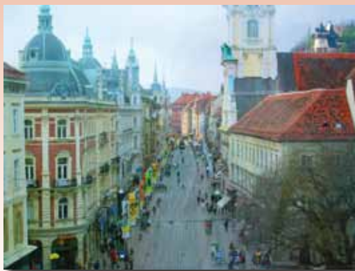
La città di Graz incentiva da quasi vent'anni la mobilità ciclopedonale anche fuori dalle strade del centro.

Quando si parla di politiche di "traffic calming", la città di riferimento è senz'altro Graz, in Austria, che dal 1992 presenta sul proprio territorio solo due limiti di velocità: 30 e 50 km/h. Il modo in cui i due limiti sono applicati è piuttosto semplice: le strade di attraversamento principale sono a 50 km/h mentre tutte le altre sono a 30 km/h. Una situazione per molti versi analoga a quella di Saronno. Il limite di velocità non è l'unico provvedimento preso per rendere l'intera città soggetta a quella che viene definita "mobilità dolce". L'Amministrazione di Graz, infatti, in questi vent'anni ha portato avanti numerose iniziative, come lo sviluppo di piste ciclabili, percorsi verdi, promozione del servizio pubblico, sistema di rotazione rapida dei parcheggi, distribuzione dei servizi in maniera tale che fossero facilmente raggiungibili in bicicletta o a piedi. Tornando ai limiti di velocità, le strade principali (circa il 20% dei 1000 km di cui è fatta la rete di Graz) con questa soluzione si fanno carico di circa l'80% del traffico, riducendo drasticamente il traffico di attraversamento nei quartieri residenziali e il rumore. Numerose sono state le iniziative per far comprendere alla popolazione le ragioni del provvedimento, come assemblee e questionari, oltre una campagna informativa permanente e a controlli stradali continui. A oggi, solo due cittadini su dieci si dichiarano contrari alle Zone 30 così strutturate.