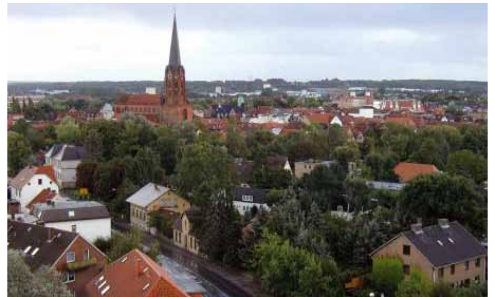
A Buxtehude i vantaggi delle Zone 30 sono stati molteplici

Per info e suggerimenti: zona30@comune.saronno.va.it