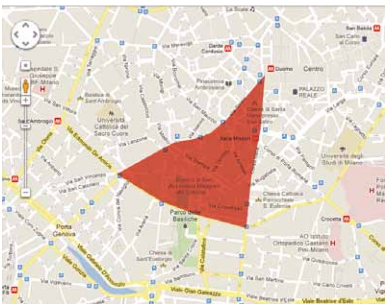
La centralissima Zona 30 di Milano riguarderà 2300 famiglie.

È di pochi giorni fa la notizia ufficiale, ma è da diversi mesi che anche a Milano, città strangolata da traffico e smog, si parla di Zone 30. La prima tra quelle che il Comune ha intenzione di avviare è l'area Missori-Torino, quel triangolo compreso tra via Torino-Cesare Correnti, corso Italia-Mazzini e il tratto della cerchia dei Navigli De Amicis-Molino delle Armi che vedete nell'immagine a corredo. Una zona ad alta concentrazione di negozi (273) e uffici (624), scuole, luoghi di culto, istituti, al cui interno vivono 2.300 famiglie. Il percorso partecipativo che verrà avviato sarà piuttosto intenso, con i cittadini - bambini compresi - che saranno chiamati non solo a partecipare ad assemblee pubbliche, ma anche a fornire idee in grado di massimizzare l'impatto sul riequilibrio del rapporto tra il traffico automobilistico e quello ciclopedonale. Il Comune di Milano effettuerà anche numerosi lavori di risistemazione stradale in modo da rendere evidente la presenza di una Zona 30 sul territorio, un lusso di questi tempi in cui i comuni hanno sempre meno risorse. Si tratta comunque del primo esempio pilota di Zona 30 a Milano, cui ne seguiranno altre su segnalazione degli stessi cittadini.