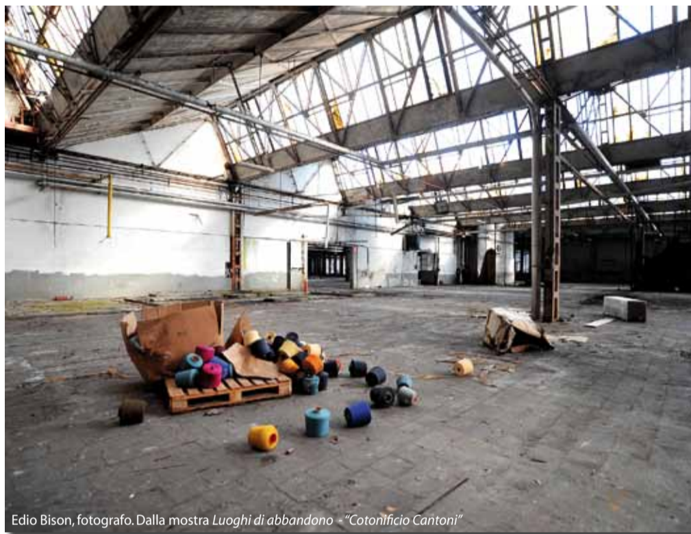
Edio Bison, fotografo. Dalla mostra Luoghi di abbandono - "Cotonificio Cantoni"