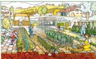
Il lavoro della terra come via educativa (G.F. Zanetti)

Seguici su Facebook "Mercato Contadino di Saronno"