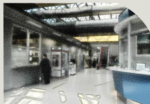
Nella ricorrenza della Festa della Donna 2014 e nell'ambito delle manifestazioni,