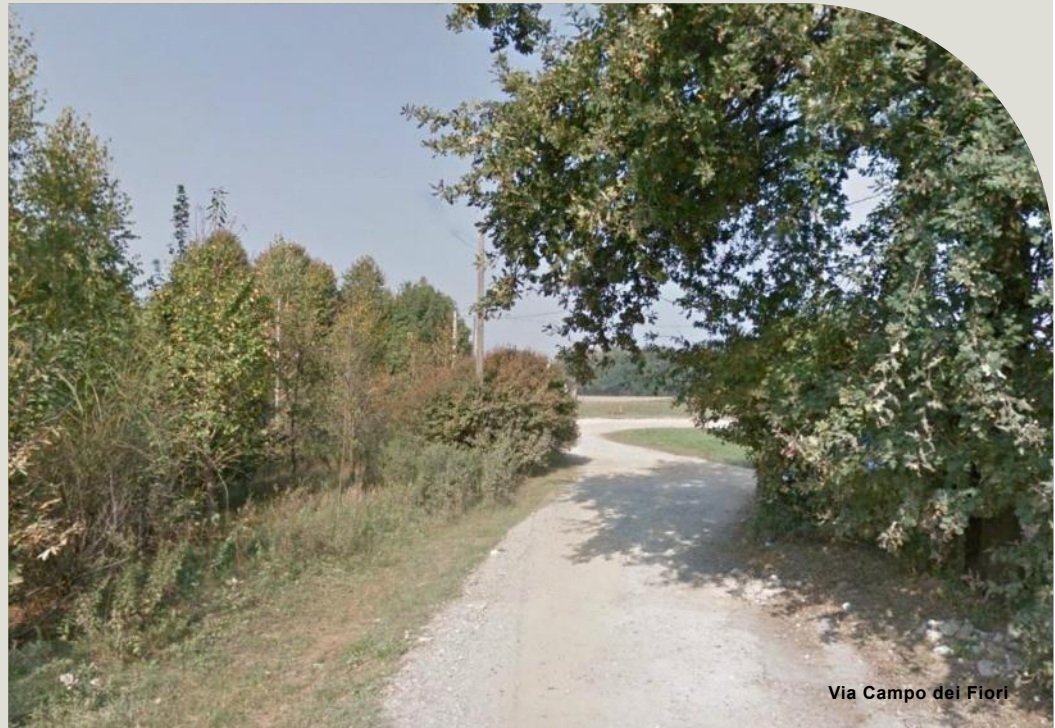
Via Campo dei Fiori

L'Equipe di pastorale battesimale di Saronno