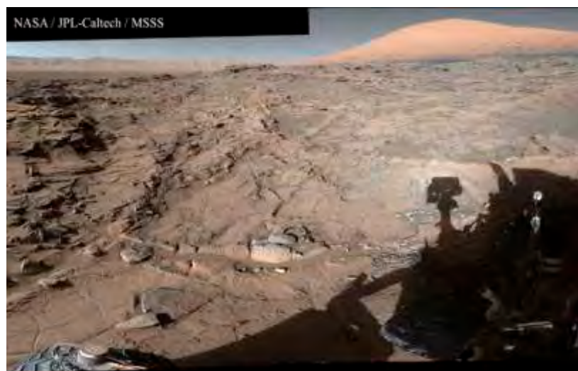
Superficie di Marte ripresa dal rover Curiosity della NASA.