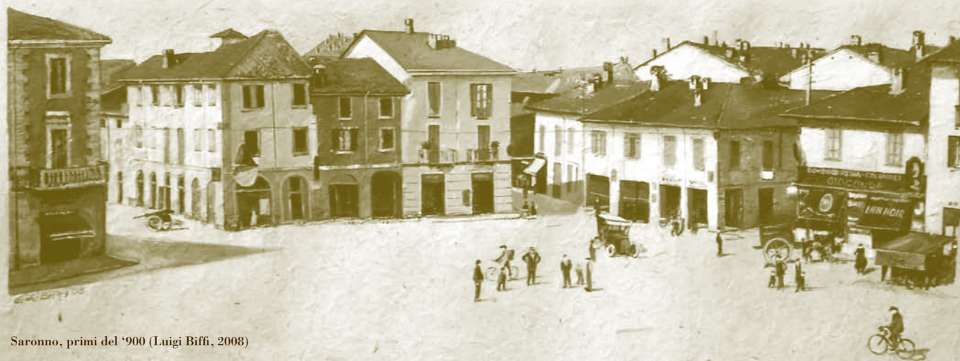
Saronno, primi del '900 (Luigi Biffi, 2008)

25 - 41 - 57 - 59 - 60 - 65 - 67 70 - 90 - 92 - 98