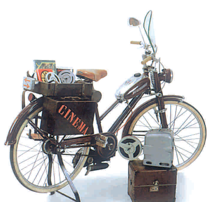
Bicicletta Mosquito per cinematografo