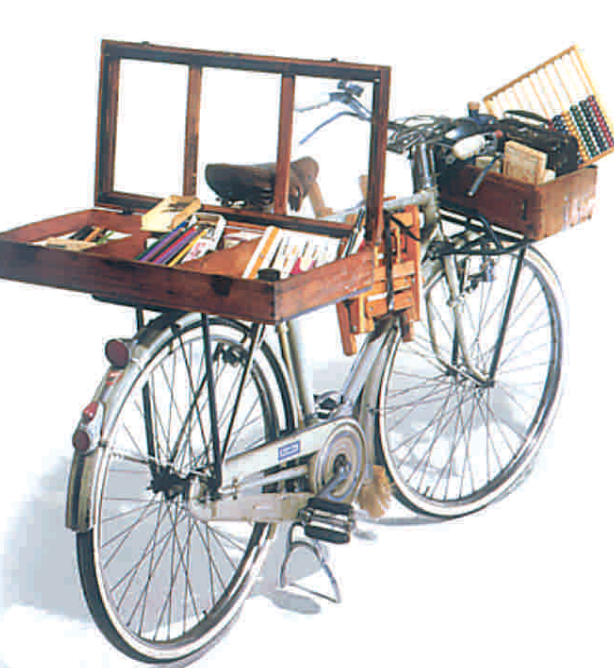
Bicicletta per cartolaio