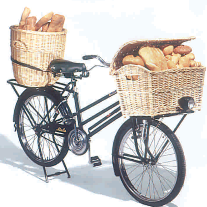
Bicicletta per panettiere