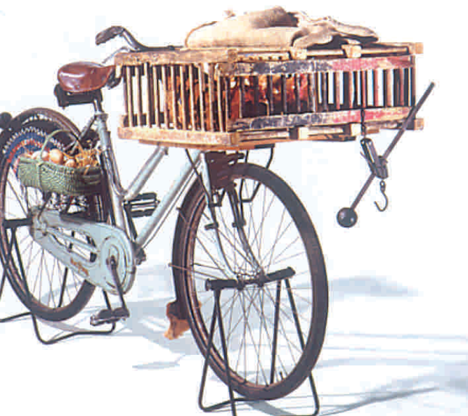
Bicicletta per venditore di polli