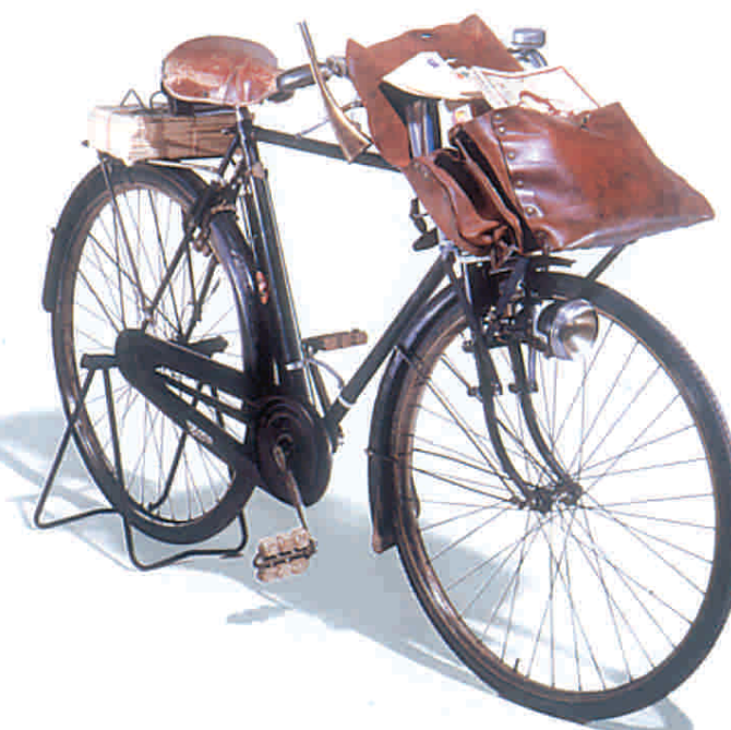
Bicicletta per postino