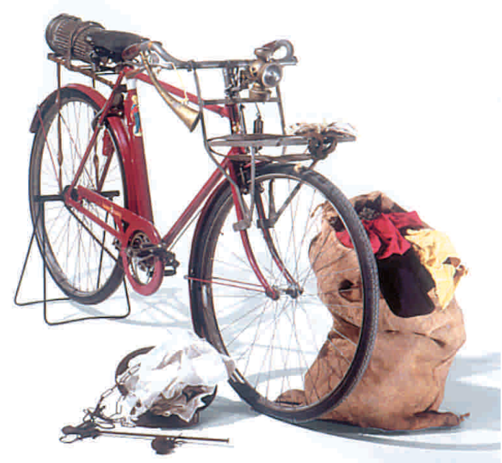
Bicicletta per straccivendolo

I NONNI SARONNESI INCONTRANO I BAMBINI CON I GIOCHI E I MESTIERI DI UNA VOLTA