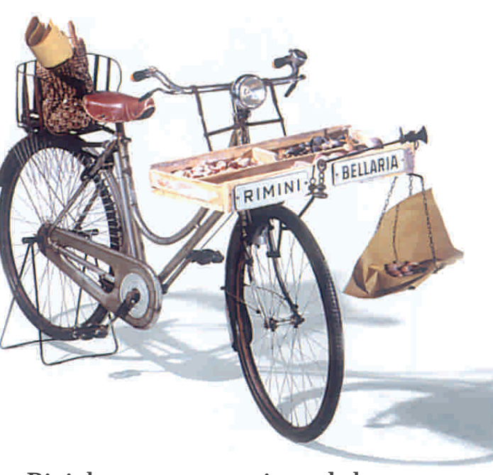
Bicicletta per pescivendolo