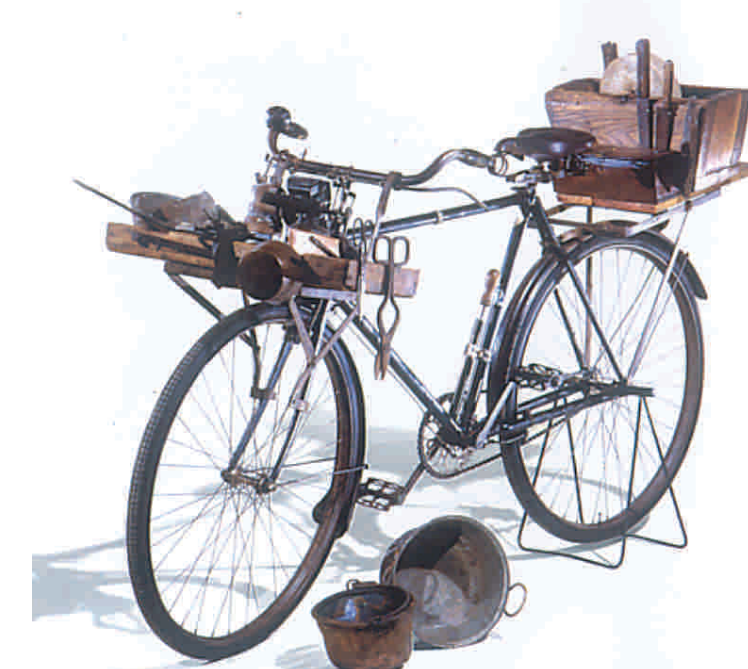
Bicicletta per ramaio - stagnino