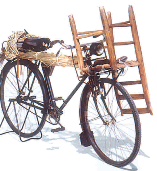
Bicicletta per impagliatore di sedie