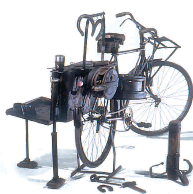
Bicicletta per maniscalco