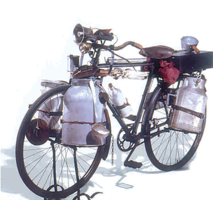
Bicicletta per lattaio