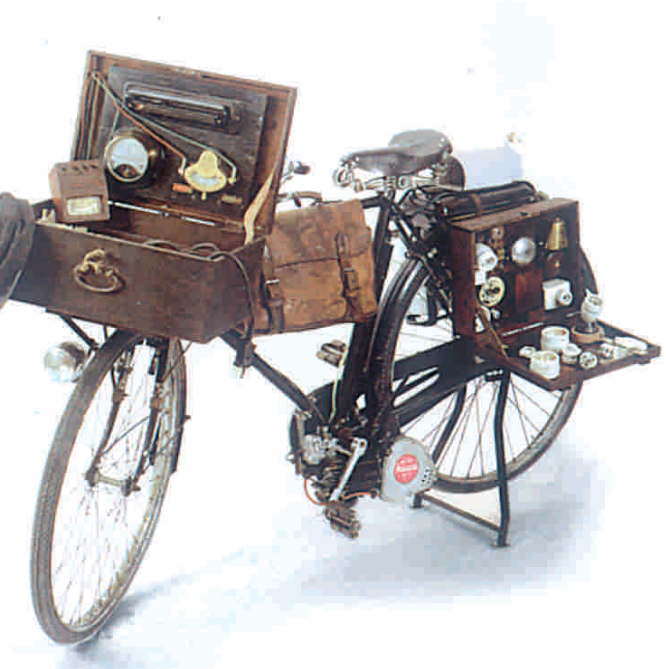
Bicicletta Mosquito per elettricista