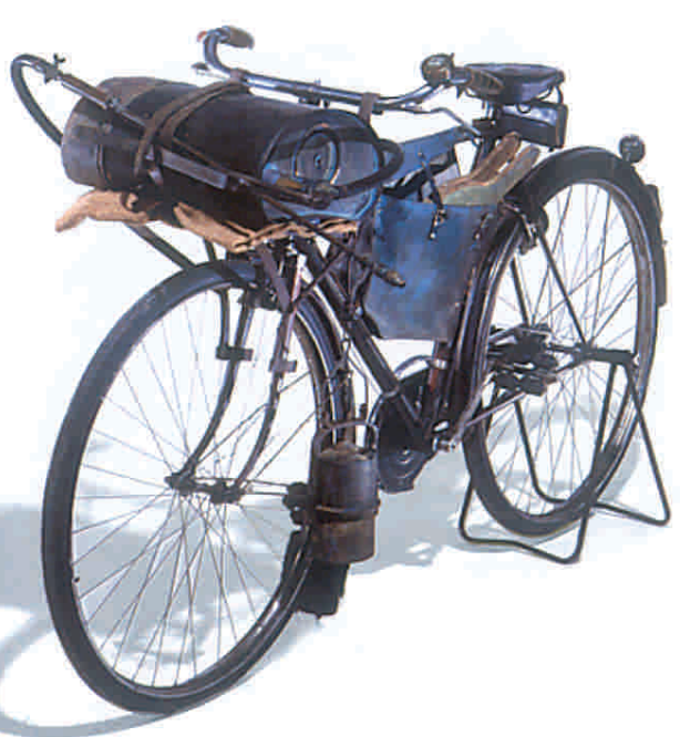
Bicicletta per zollatore