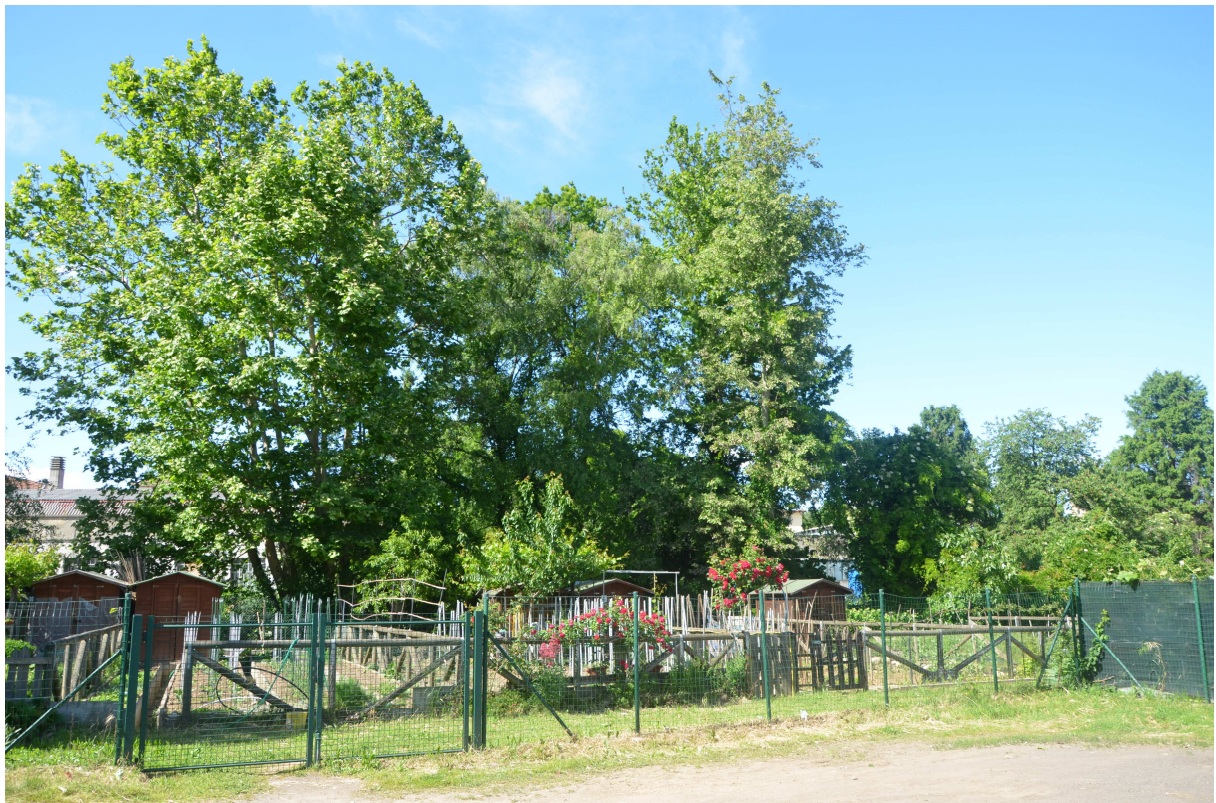
21. ARU 2 - Il sistema degli orti urbani – Accesso dal parcheggio lungo Via Bellavita