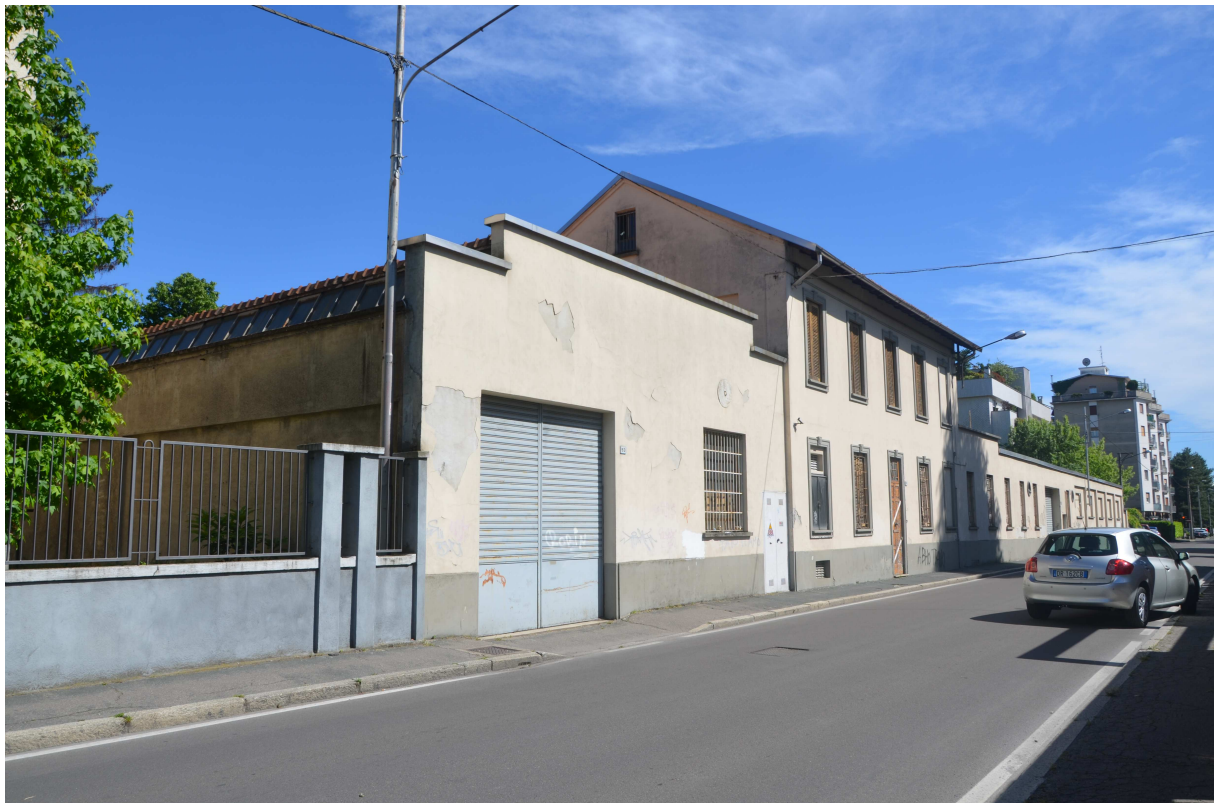
22. ARU 2 – Vista della proprietà dalla Via Volta