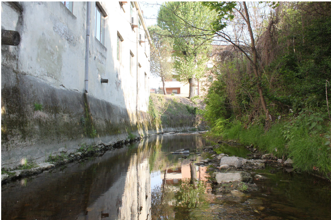
7. ARU 2 - Sponde del Torrente Lura con fabbricati adiacenti