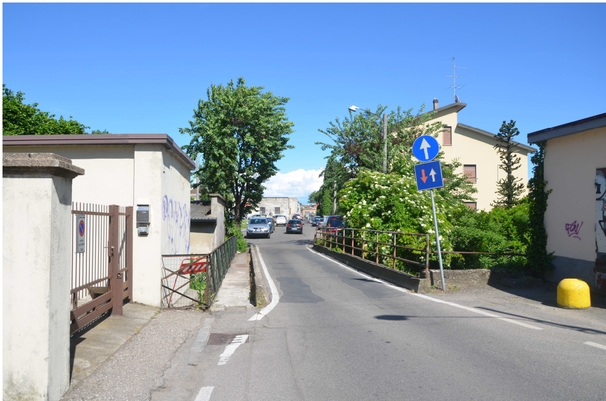
1. ARU 2 - Via Montoli ponte sul Torrente Lura