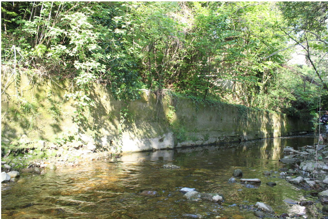
12. ARU 2 - Sponda del Torrente Lura con muro di sostegno in calcestruzzo con “pennelli” alle fondazioni