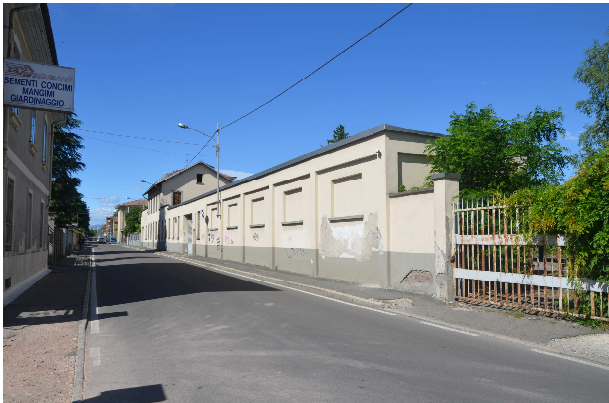
23. ARU 2 - Vista della proprietà dalla Via Volta