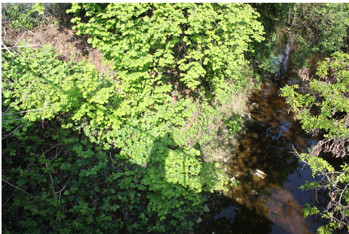
16. ARU 2 – Vista dal ponte di Via Bellavita delle sponde del Torrente Lura vicino agli orti comunali