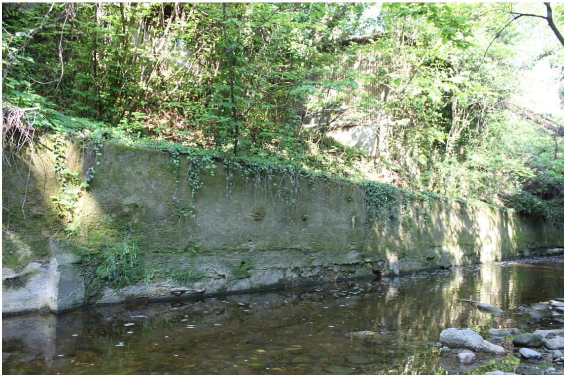
11. ARU 2 - Sponde del Torrente Lura con muro di sostegno in calcestruzzo con “pennelli” alle fondazioni