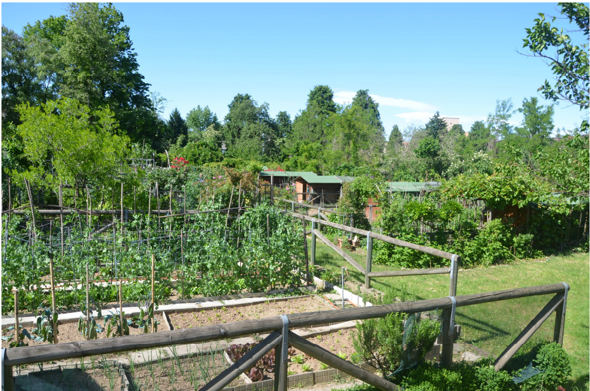
20. ARU 2 – Il sistema degli orti urbani – Distribuzione interna