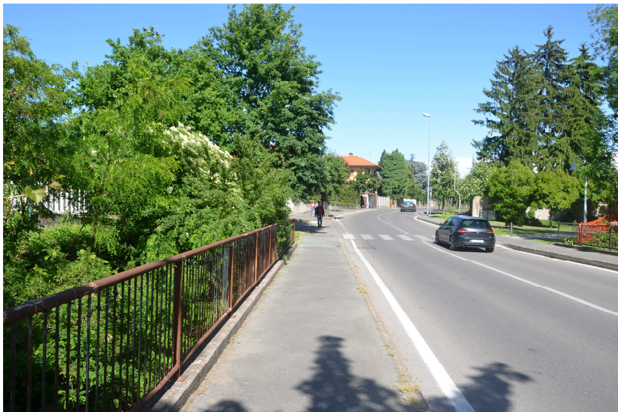
19. ARU 2 – Vista del ponte di Via Bellavita sul Torrente Lura