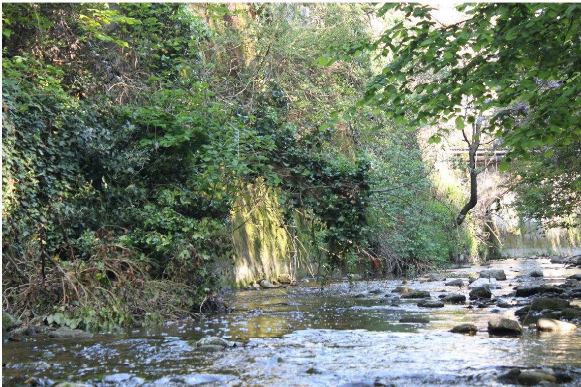
6. ARU 2 - Sponde del Torrente Lura con fabbricati adiacenti e muri di sostegno in calcestruzzo