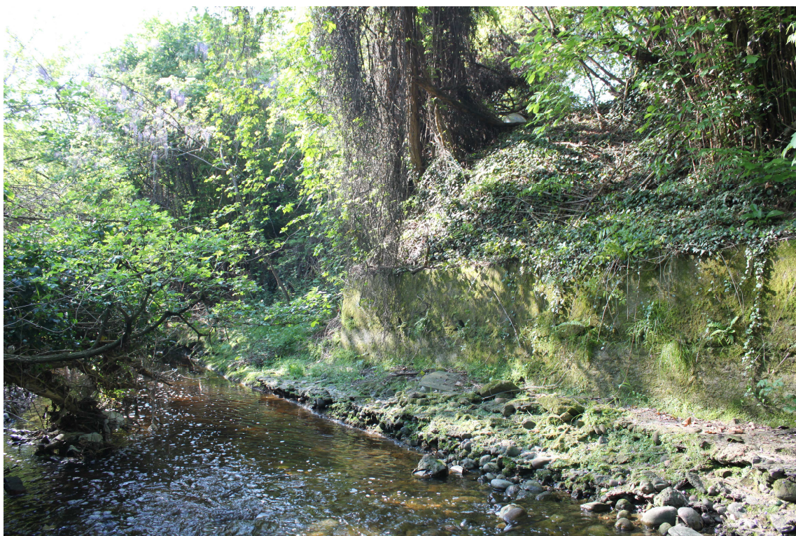
13. ARU 2 - Sponda del Torrente Lura con muro di sostegno in calcestruzzo