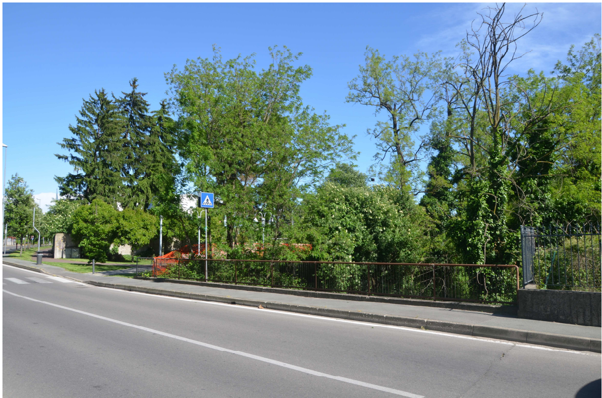
18. ARU 2 – Vista del ponte di Via Bellavita sul Torrente Lura