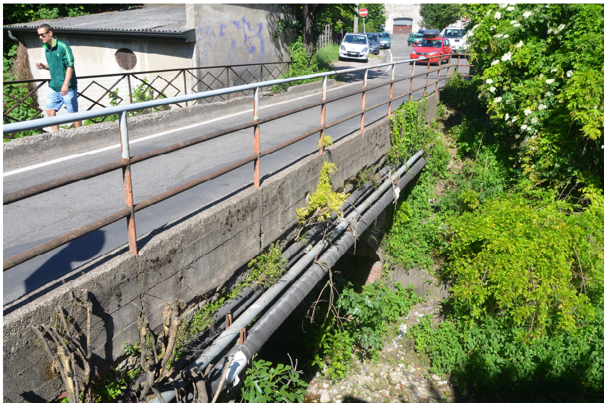
3. ARU 2 - Via Montoli ponte sul Torrente Lura