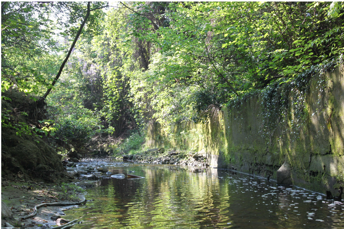
9. ARU 2 - Sponde del Torrente Lura con muro di sostegno in calcestruzzo con “pennelli” alle fondazioni