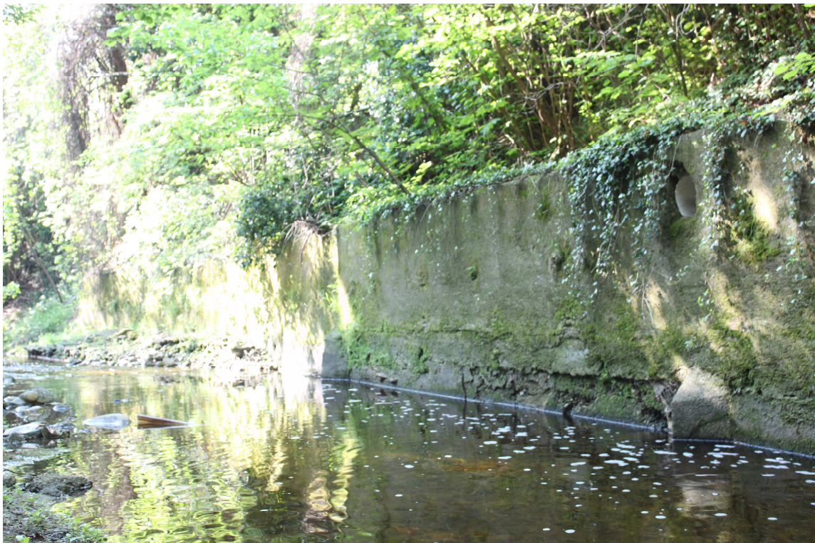
10. ARU 2 - Sponde del Torrente Lura con muro di sostegno in calcestruzzo con “pennelli” alle fondazioni e con scarico acque chiare da chiudere