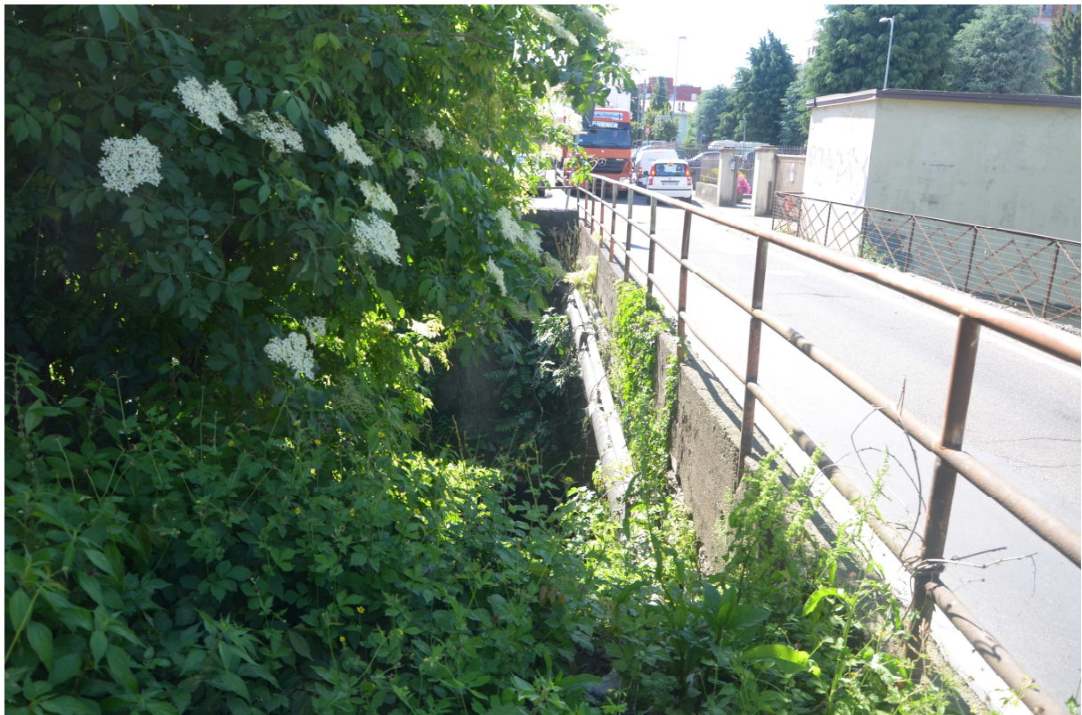
2. ARU 2 - Via Montoli ponte sul Torrente Lura