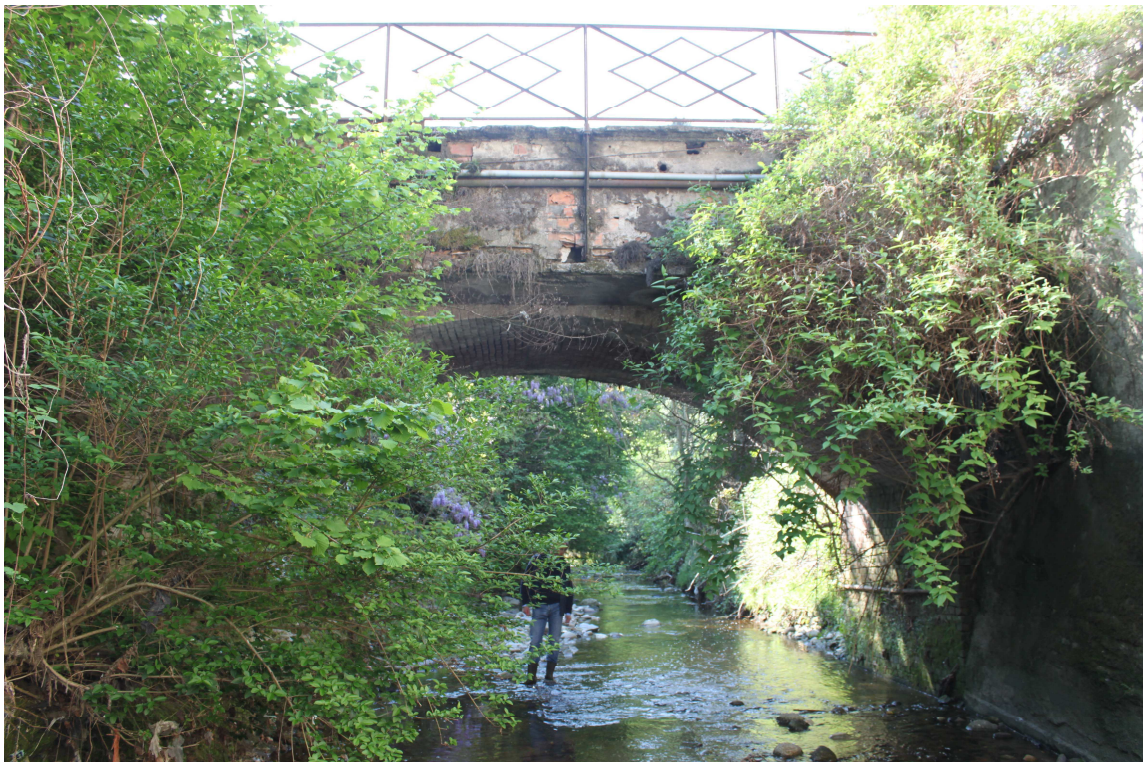
5. ARU 2 - Ponte di Via Montoli visto dal Torrente Lura