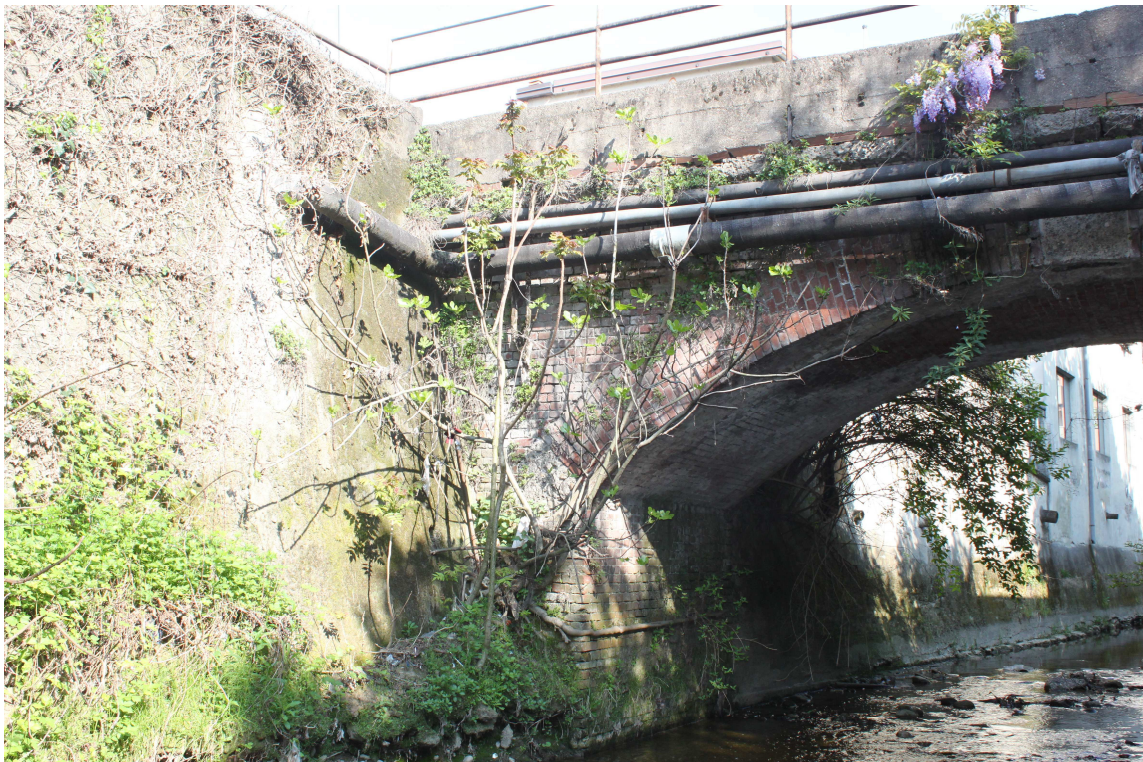
4. ARU 2 - Ponte di Via Montoli visto dal Torrente Lura