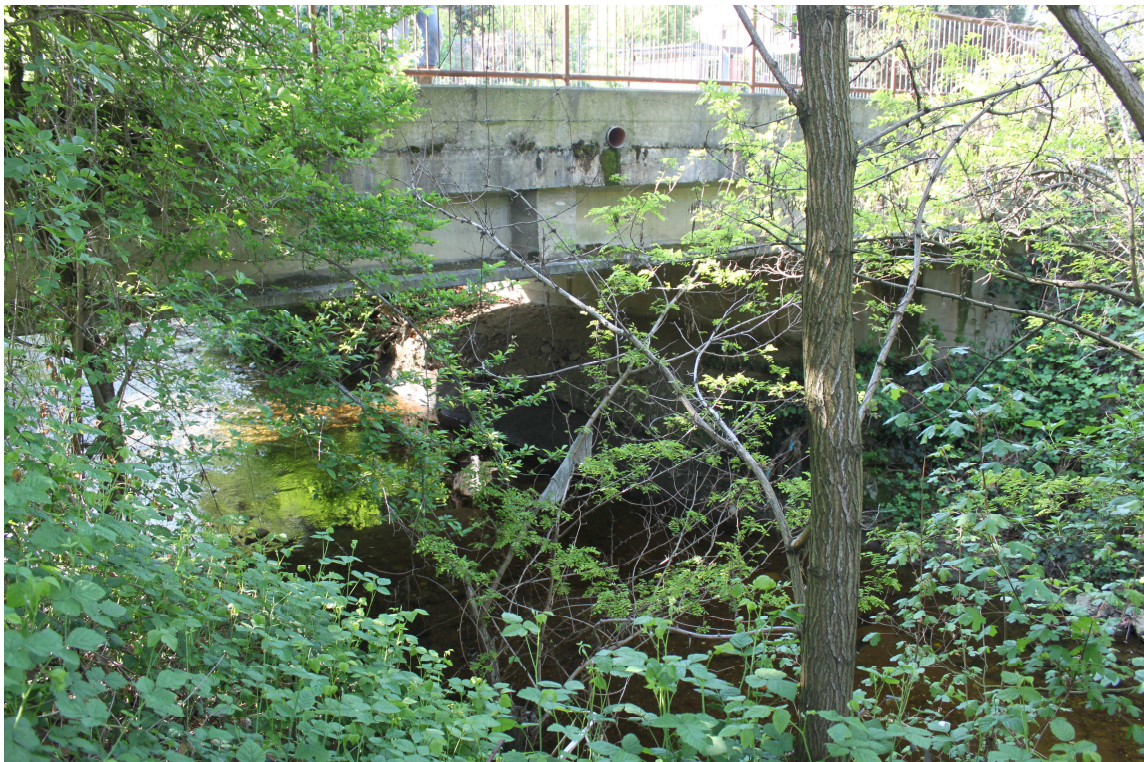
17. ARU 2 – Vista del ponte di Via Bellavita e delle sponde del Torrente Lura