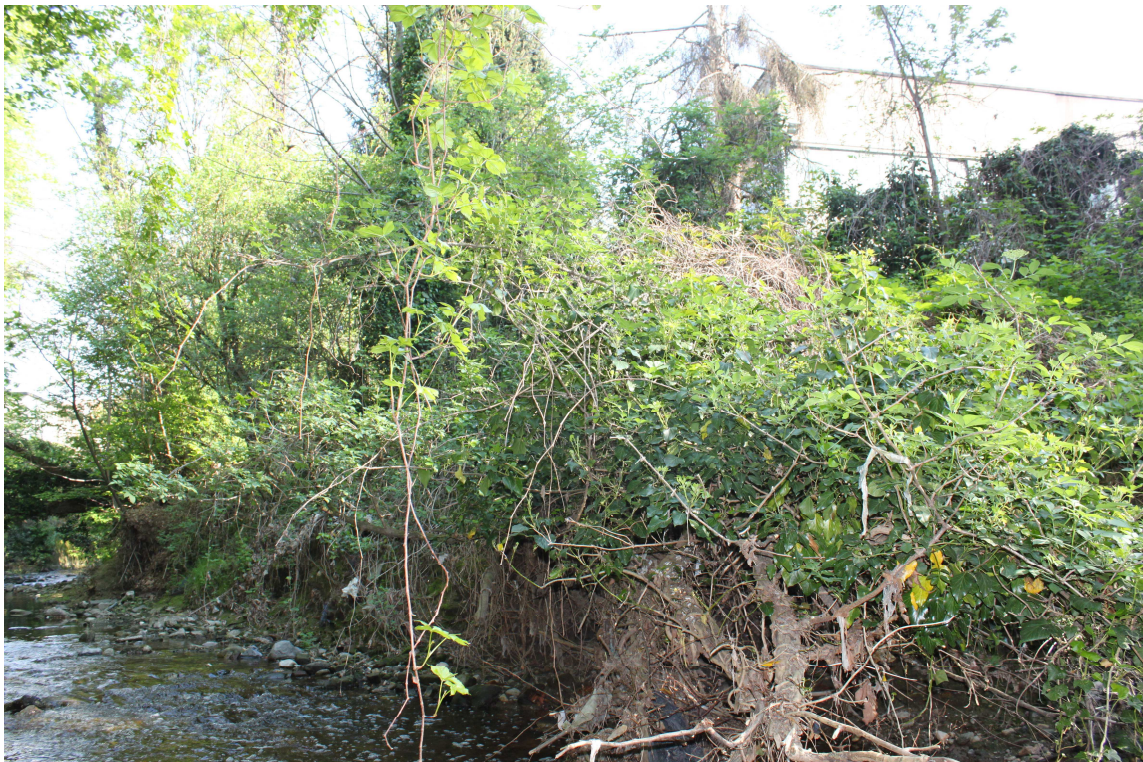
14. ARU 2 - Sponda del Torrente Lura vicino agli orti comunali