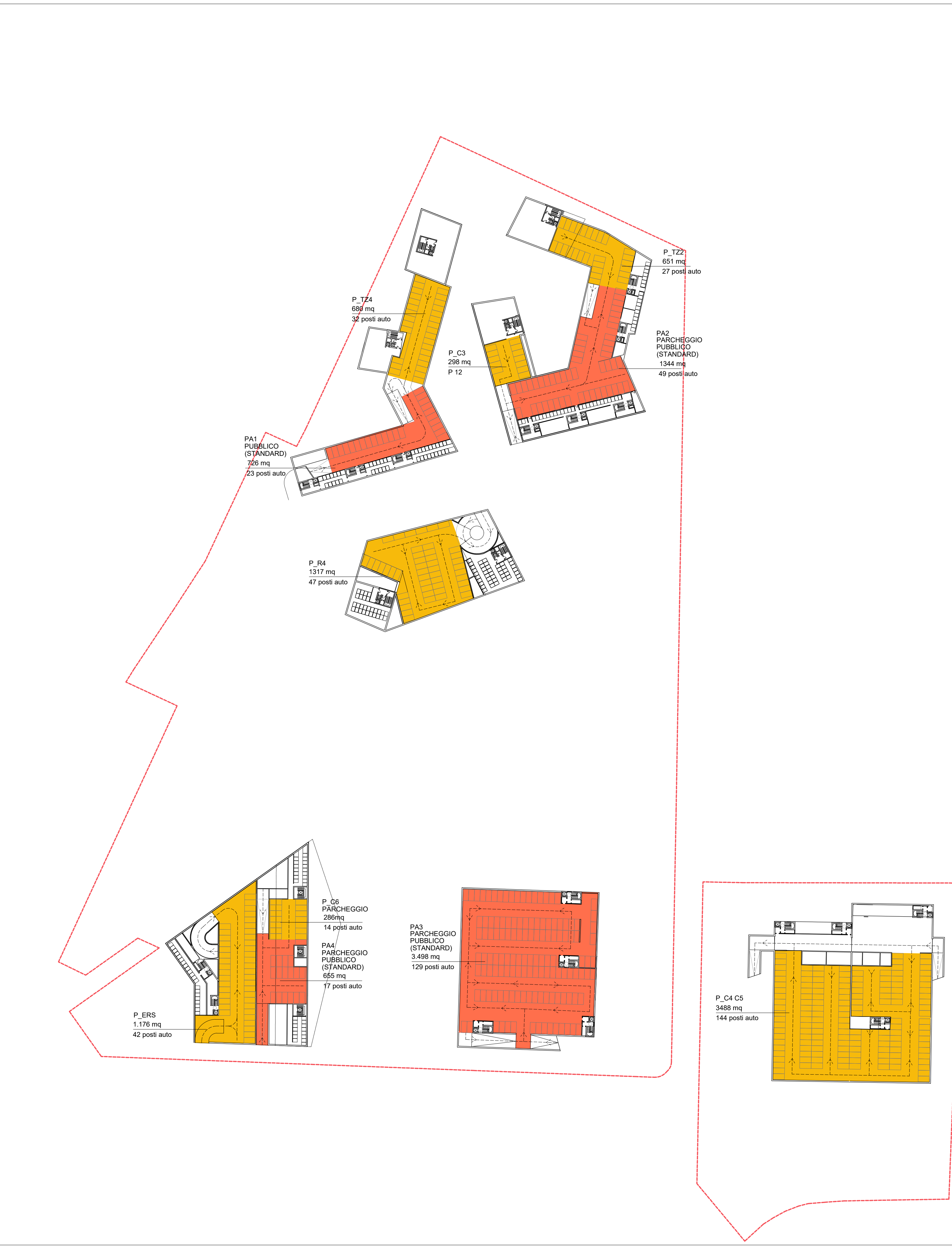
PIANTA PRIMO PIANO INTERRATO 1:1000