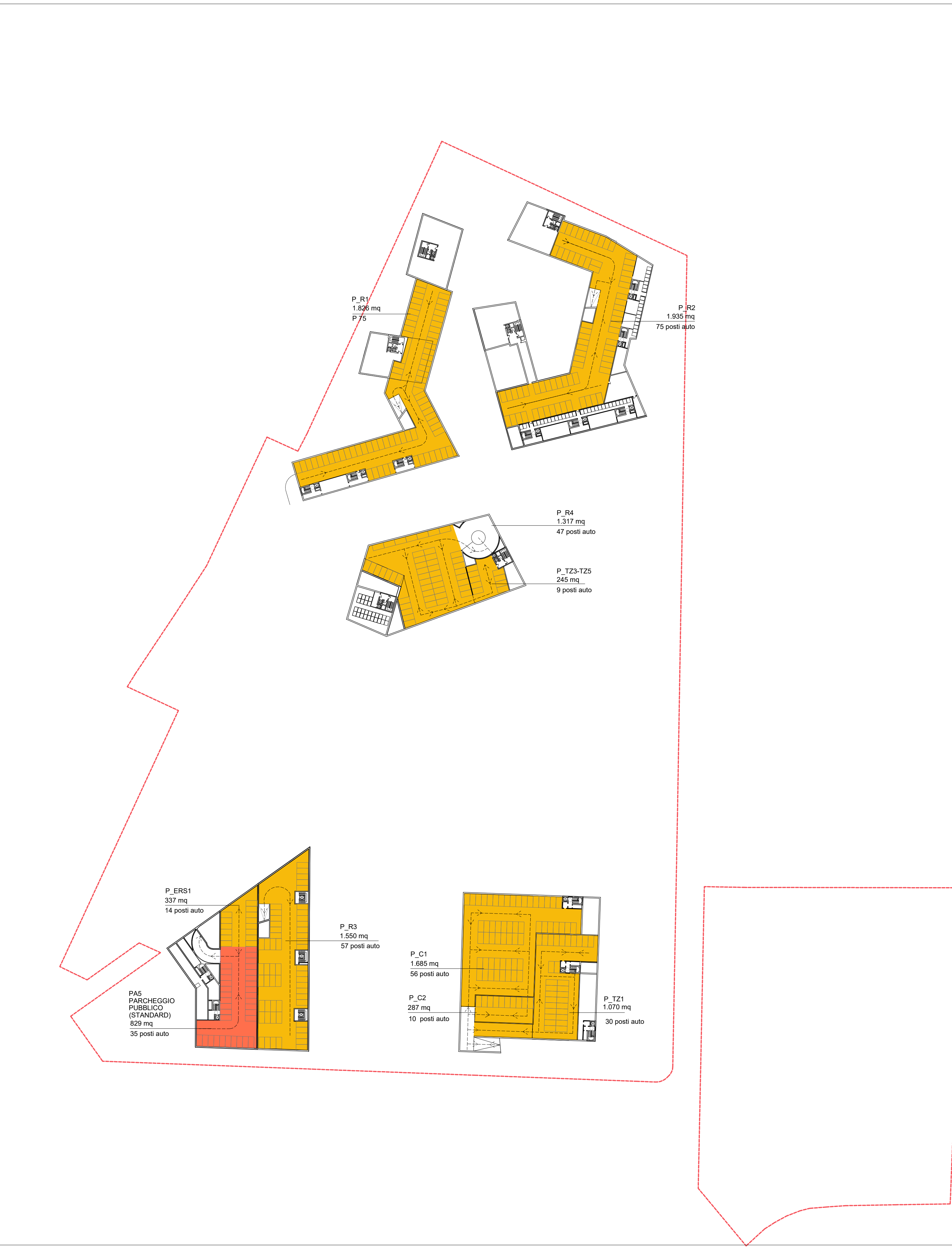
PIANTA SECONDO PIANO INTERRATO 1:1000